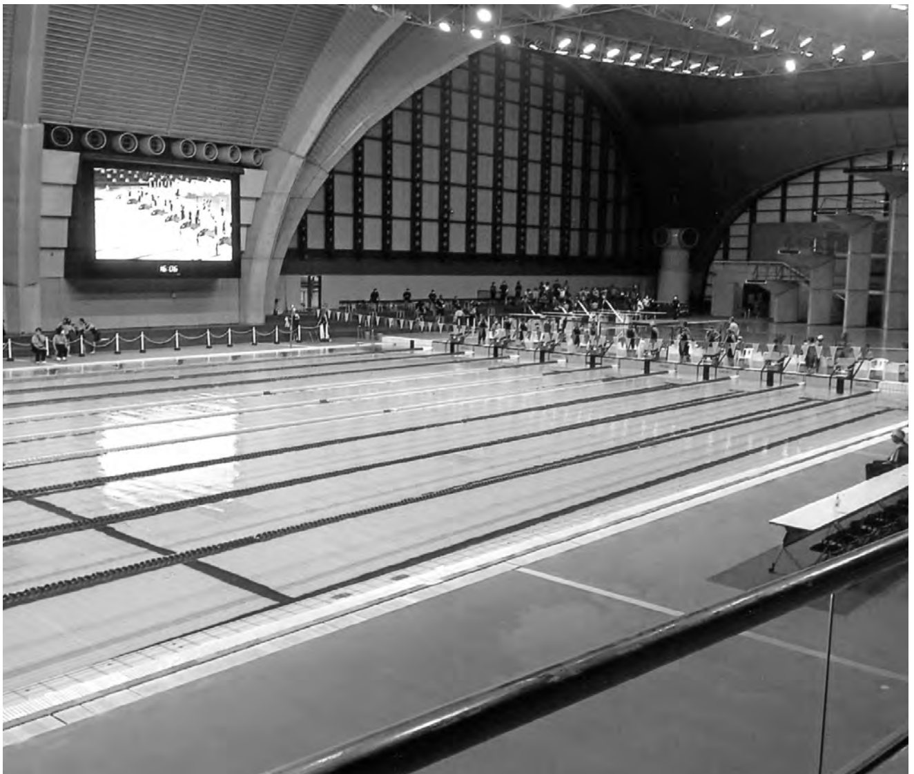
東京辰巳国際水泳場