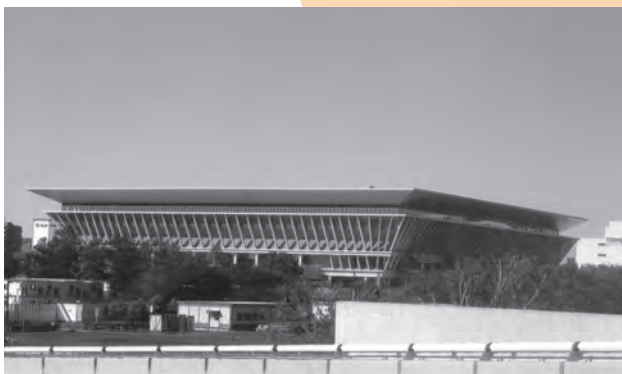
昨年新設された東京オリンピックで競泳が行われた東京アクアティクスセンター