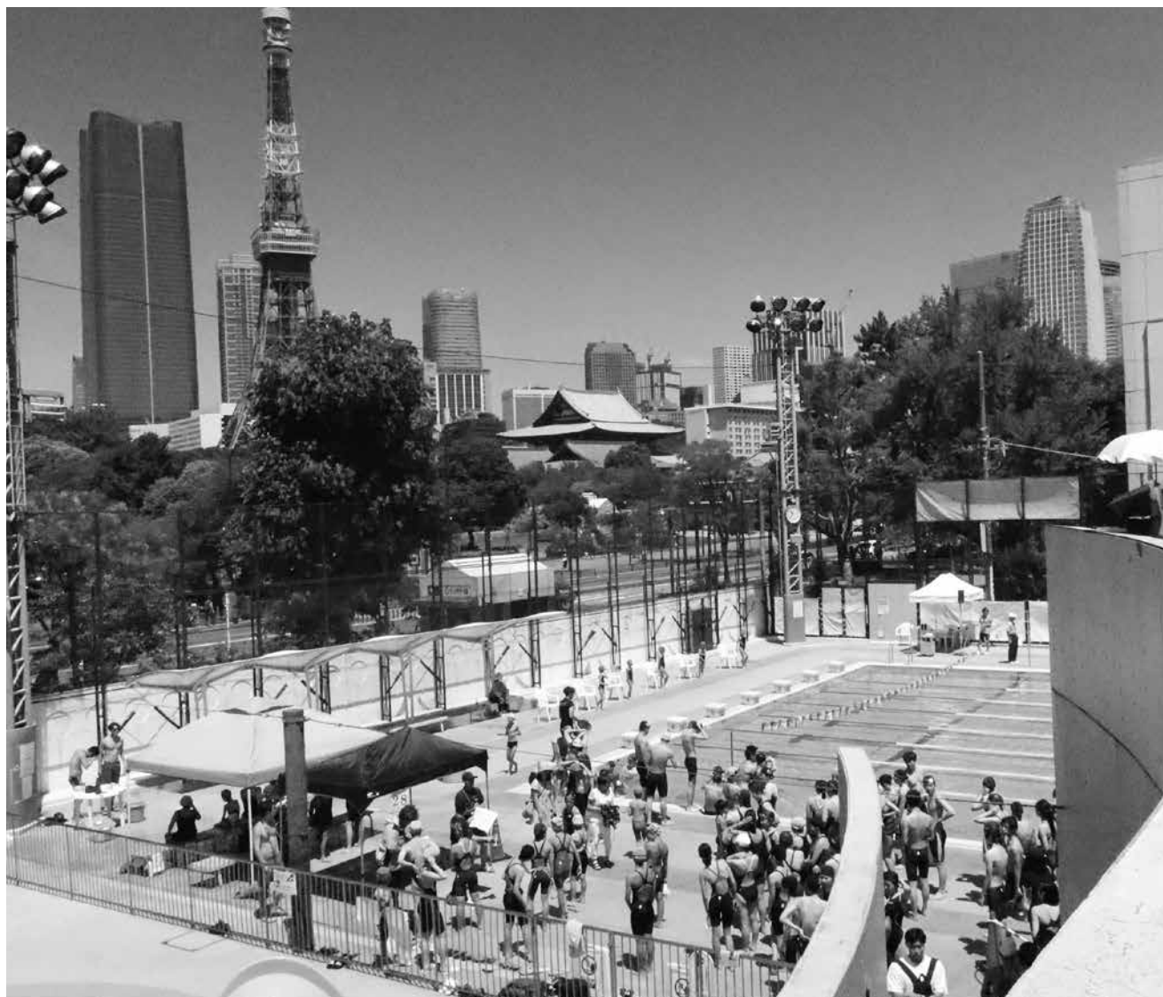
アクアフィールド芝公園