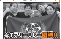
女子フリーリレー優勝!!