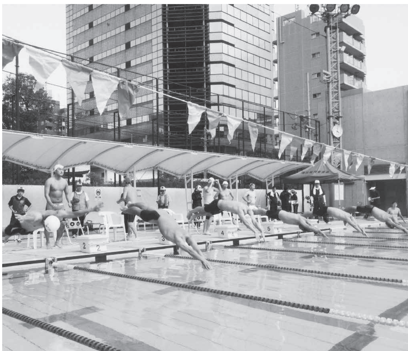
アクアフィールド芝公園