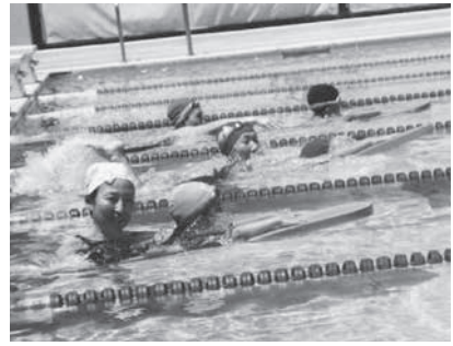
幼児 ビート板でバタ足に挑戦

言った時の笑顔とリレーでの金メダルと良い思い出をゲット。練習に励んで来年も大会に臨みます。